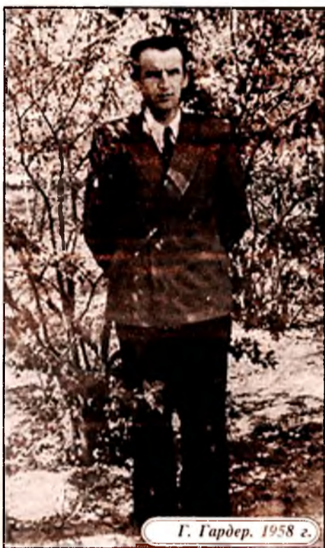
Г. Гардер. 1958 г.

Известно, что в царские времена Казахстан являлся местом ссылки революционеров, вольнодумцев, политически неблагонадежных и др. В эпоху сталинизма эта политика получила свое драматическое продолжение. Казахстан превратился в большой лагерь.